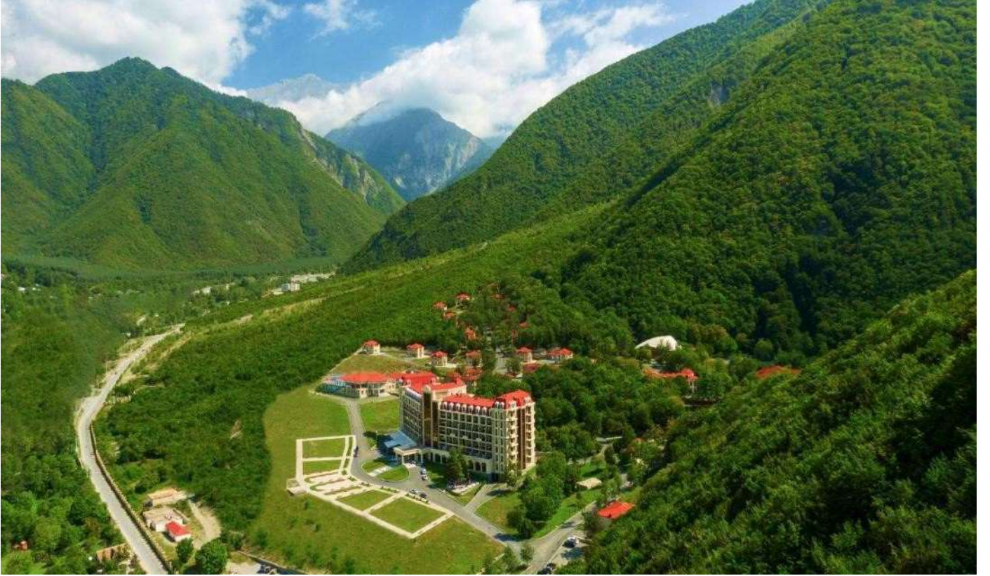
Marxal Resort & Spa Hotel***** Şeki

Bu ziyaretimizden sonra Şeki'ye doğru yolumuza devam ediyoruz ve öğle saatlerinde Şeki'ye varışımızla bir restoranda öğle yemeğimizi alıyoruz. Yemek sonrası ilk ziyaret noktamız ise uzun bir geçmişe sahip olan ve Tarihi İpek Yolunun önemli şehirlerinden olan Şeki'de 1797 yılında yapılmış olan Han Sarayı (Khan's Palace) olacaktır. Unesco Dünya Kültür Mirası listesinde olan ve 18 yüzyılda tek bir çivi kullanılmadan yazlık ikametgâh olarak inşa edilmiş olan bu sarayı ziyaret ettikten sonra, Azerbaycan mimarisinin bir şaheseri olan 18. yüzyıldan kalma Şeki Kalesi 'ni geziyoruz. Ardından kale içerisinde bulunan Etnografya ve Uygulamalı Sanatlar Müzesi 'ni geziyoruz. Bu müze ziyaretinin ardından bu bölgede bulunan Kervansaray ve Kış Sarayı 'ni da gördükten sonra otele transfer ve serbest zaman. Konaklama: Marxal Resort & Spa ***** Şeki.