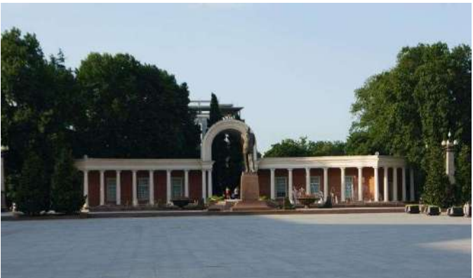
Haydar Aliyev Meydanı