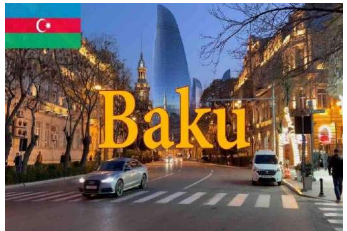
Alev Kuleleri & Little Venice (Küçük Venedik), Bakü