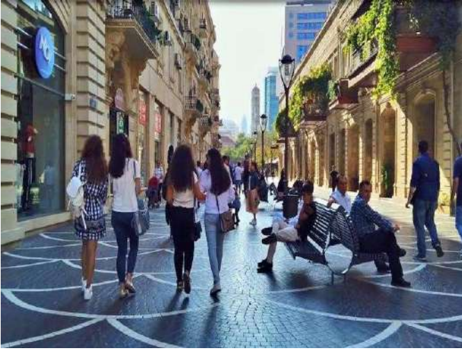
Nizami Caddesi, Bakü