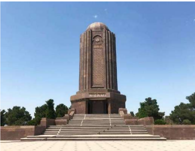
Nizami Gencevi Anıtı