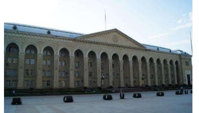
Belediye Binası, Gence