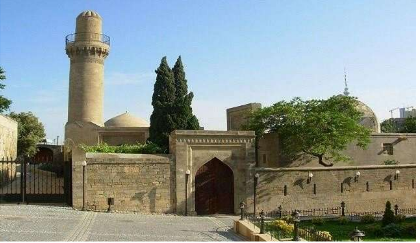
Şirvanşahlar Sarayı, Bakü

Müze ziyaretimizden sonra bir restoranda öğle yemeğimizi alıyoruz. Yemekten sonra Bakü gezimize, UNESCO Dünya Kültür Mirası olarak kabul edilen İçeri Şehir (Eski Şehir)'de 15. yüzyılda İbrahim Halilullah döneminde yapılmış Şirvanşahlar Sarayı , 2500 yıllık geçmişe sahip Kız Kulesi ve 1960 yılında Bakü Bulvarı'nda inşa edilmiş olan Little Venice (Küçük Venedik), 181 metreye ulaşan ve 3 adet kuleden oluşan Alev Kuleleri (Flame Towers)'ni gördükten sonra Bakü'nün en önemli alışveriş caddesi olarak bilinen Nizami Caddesi gezip göreceğimiz yerler arasındadır.