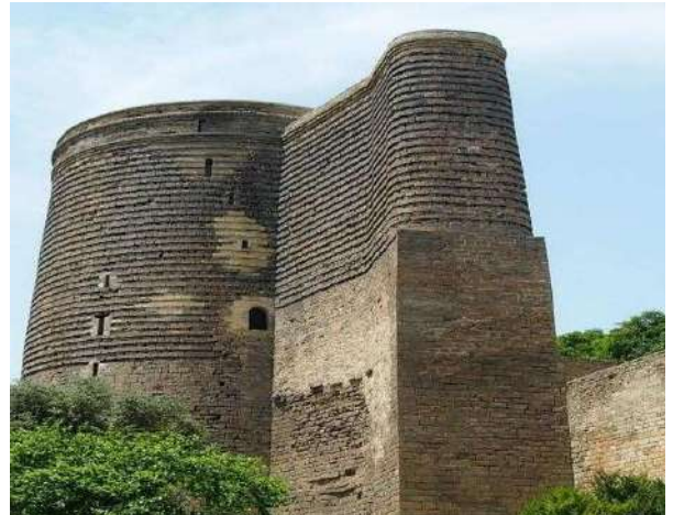
Kız Kulesi , Bakü