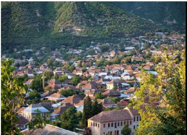
Eski Şehir, Şeki