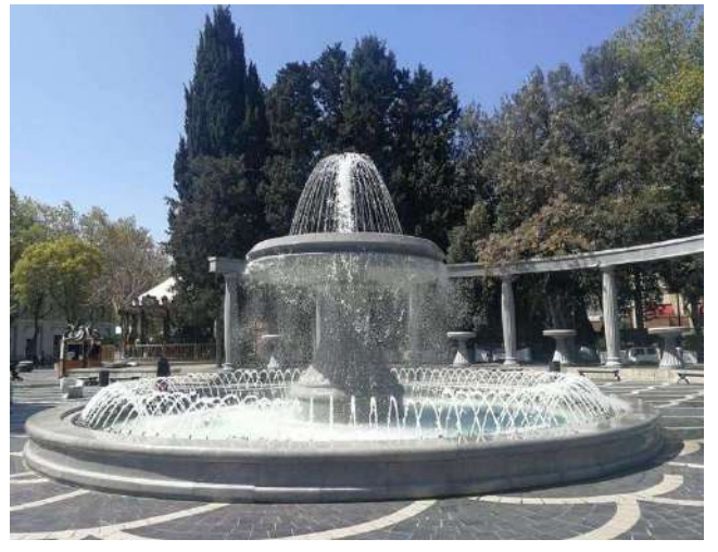
Fevrareler Meydanı, Bakü

Nizami Caddesi'ndeki serbest zamanın ardından otobüsümüzle otele transfer ve serbest zaman. Konaklama: Midtown Hotel **** Bakü . www.midtownhotel.az