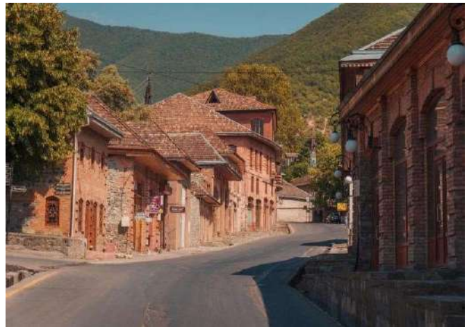
Eski Şehir, Şeki