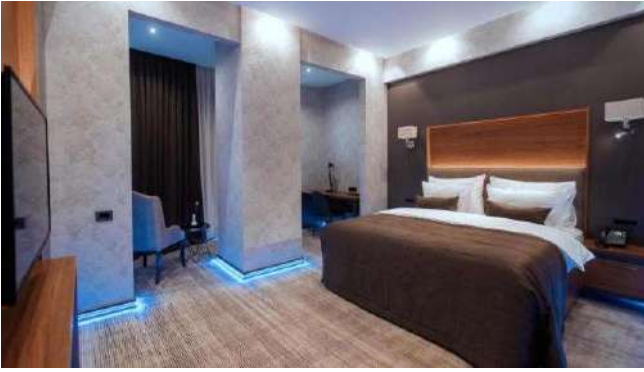
Midtown Hotel **** Bakü

Nizami Caddesi'ndeki serbest zamanın ardından otobüsümüzle otele transfer ve serbest zaman. Konaklama: Midtown Hotel **** Bakü . www.midtownhotel.az