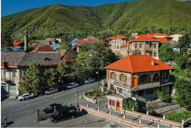
Eski Şehir, Şeki

Kiş Kilisesi ziyaretimizin ardından, Şeki şehir merkezine dönüyoruz ve Eski Şehir'de serbest zaman veriyoruz. Serbest zamanın ardından Şeki'den ayrılıyor Azerbaycan'ın Gence şehrine hareket ediyoruz. Akşam saatlerinde varacağımız Gence'de otele transfer ve serbest zaman. Konaklama: Premium Hotel Ganja**** v.b. Gence.