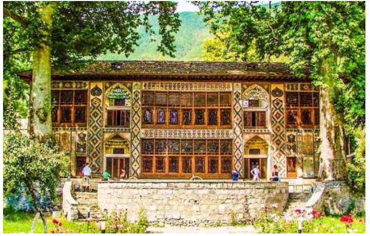
Han Sarayı, Şeki