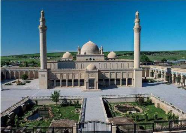
Şamahı Cuma Camii

Sabah otelde alacağımız kahvaltının ardından Bakü'den ayrılıyor ve Azerbaycan'ın tarihi ve doğal güzellikleriyle ünlü Şeki 'ye hareket ediyoruz. İlk ziyaret noktamız yol güzergahımız üzerinde Şamahı şehrinde bulunan ve Azerbaycan Cumhuriyeti topraklarındaki en eski cami olan Şamahı Cuma Camii . Camii, Azerbaycan Cumhuriyeti Kültür ve Turizm Bakanlığı tarafından ulusal öneme sahip tarihi ve kültürel bir anıt olarak tescillenmiştir. Cami 743-744 yıllarında yapılmıştır. Şamahı Cuma Camii, Derbend Cuma Camii'nden sonra en eski camidir. Orta Çağ'da birkaç kez onarım gören camii, 1852 ve 1902 yılında meydana gelen depremlerde yıkılmıştır. 1918 yılında Ermeniler tarafından yakılan camide son onarım çalışmaları 2010-2013 yıllarında Azerbaycan Cumhurbaşkanı İlham Aliyev'in talimatıyla yapılmıştır.