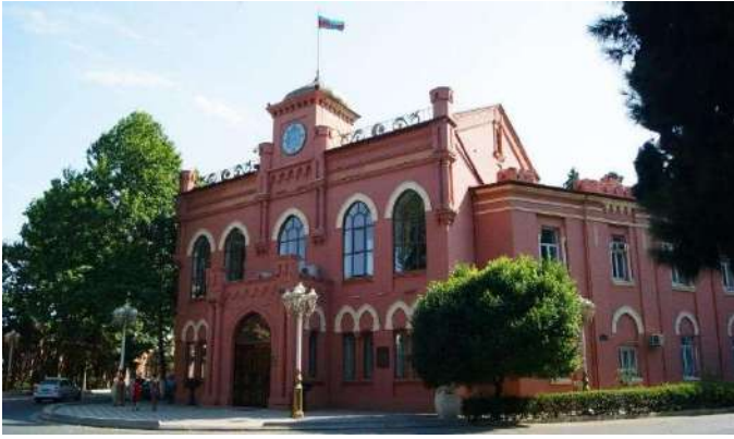
Eski Parlamento Binası