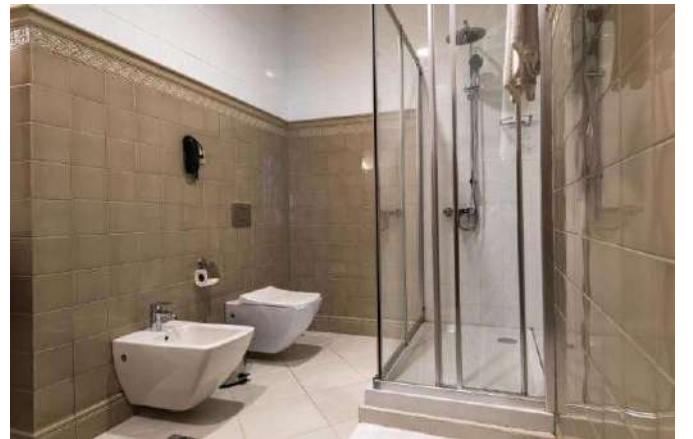
Marxal Resort & Spa Hotel***** Şeki