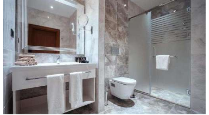
Midtown Hotel **** Bakü