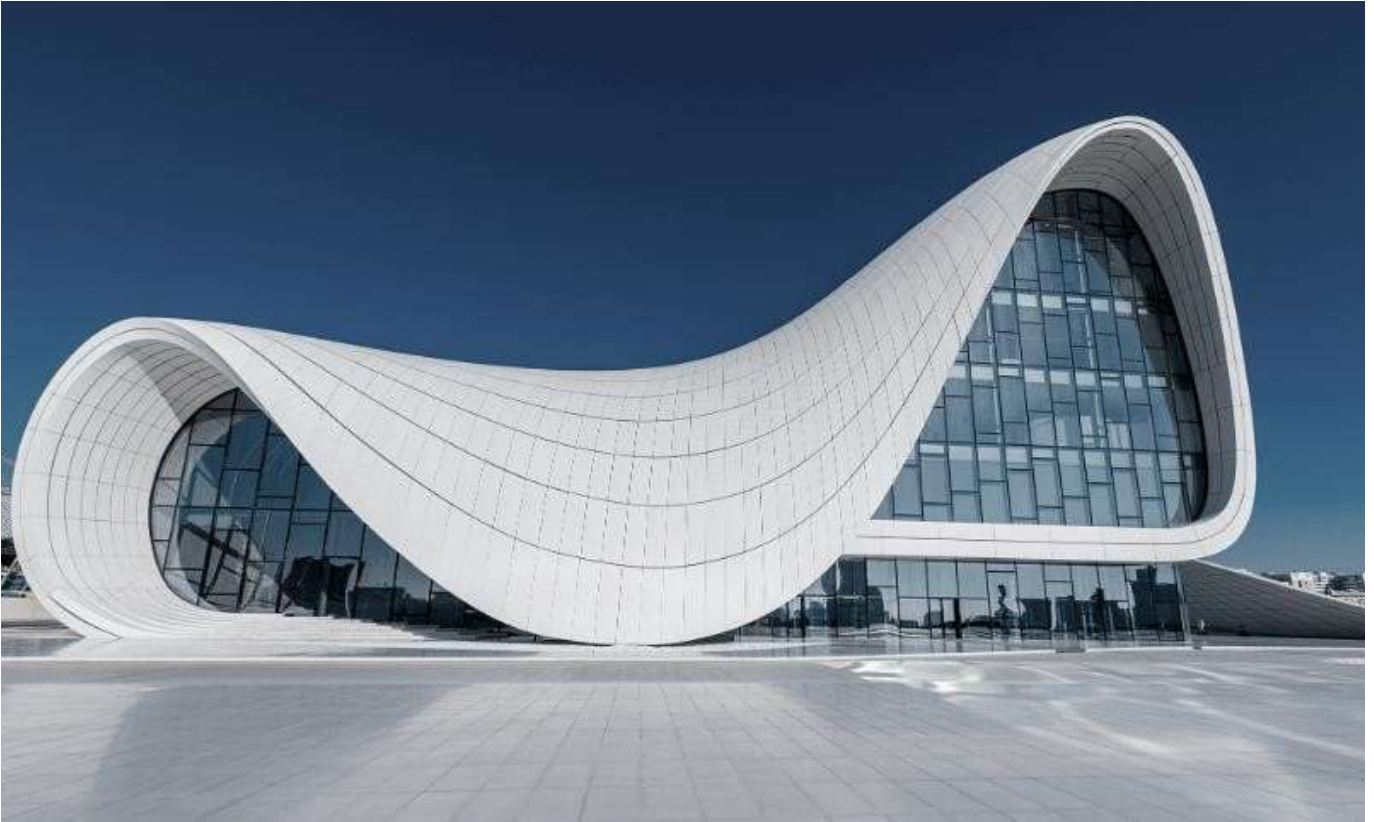
Haydar Aliyev Kültür Merkezi

Burada alacađımız fotoğraf karelerinin ardından ise, ünlü Seyyah Marco Polo'nun "Ateş Ülkesi" olarak adlandırdığı Yanardađ 'ı gezeceđiz. Ateşgah gezimizden sonra, Abşeron Yarımadası'nda bulunan arkeolojik eserlerin yer aldığı, Kale Açık hava Arkeoloji ve Etnografya Müzesi 'ne gidiyoruz. 156 hektarlık bir alanı kaplayan kompleks içerisinde, 216 tane mimari ve arkeolojik eser bulunmaktadır. Burada bulunan eserler arasında en eski tarihi eser M.Ö. üç bin yıl öncesinden beri insan yaşadığını görmekteyiz. Bu müze ziyaretimizden sonra Ünlü Mimar Zaha Hadid'in konsept tasarımı olan ve Azerbaycan'ın en önemli yapılarından biri olarak gösterilen Haydar Aliyev Kültür Merkezi 'ne gidiyoruz. Ziyaret ve fotoğraf molasından sonra bu günkü turumuzu tamamlıyor ve otelimize dönüyoruz ve serbest zaman. Konaklama: Midtown Hotel **** Bakü . www.midtownhotel.az