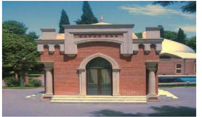
Cevat Han Türbesi