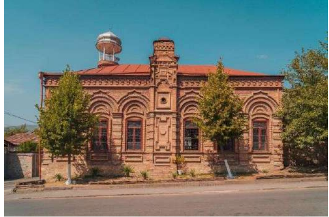
Eski Şehir, Şeki