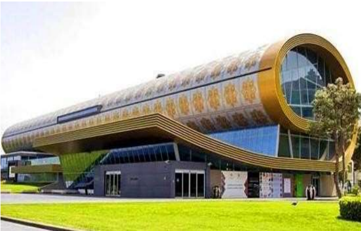
Azerbaycan Halı Müzesi

21 Mayıs 2024 Salı günü gece 23:00'da İstanbul Havalimanı Dış Hatlar Terminali'nde buluşma. Check-in işlemlerini müteakip 22 Mayıs 2024 Çarşamba gece saat 01:35'de THY'nin TK 338 tarifeli seferi ile Azerbaycan'ın başkenti Bakü 'ye uçuş. 2 saat 50 dakikalık bir uçuşun ardından yerel saatle 05:25'de Bakü Haydar Aliyev Havalimanı'na iniş. Pasaport (T.C. Kimlik) işlemlerinin ardından tur rehberi tarafından karşılanma ve özel otobüsümüzle Kafkaslar'ın en büyük şehri, en önemli bilim ve ticaret merkezi olan Bakü şehir merkezine doğru yola çıkıyoruz. Zaman zaman yürüyerek gerçekleştireceğimiz Hazar Denizi 'nin incisi Bakü şehir turumuza Bakü'nün simgeleri arasında yer alan Bakü Alev Kuleleri yakınlarında bulunan, Bakü'nün en güzel manzarasını fotoğraflayacağımız Highland Park gezisi ile başlıyoruz. Burada vereceğimiz fotoğraf molası sonrasında Bakü Türk Şehitliği 'ni ziyaret ediyoruz. 1918 yılında Rusya-Azerbaycan ihtilafı sırasında Osmanlı İmparatorluğu Azerbaycan'a asker göndermiştir. 1130 Türk askerinin şehit düştüğü savaşı Rus Ordusu kaybetmiştir. Bakü uğruna savaşta şehit düşmüş Azerbaycanlı ve Türk askerlerin bulunduğu şehitlik gezimizin ardından Azerbaycan Halı Müzesi 'ne gidiyoruz.