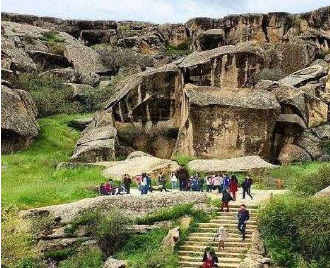
Gobustan Rock Art Cultural Landscape