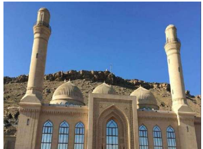
Bibi Heybet Camii