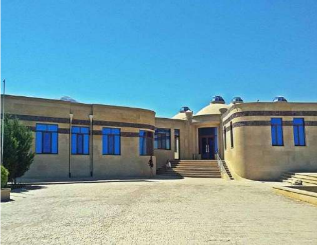
Gobustan Ulusal Park Müzesi

Konaklama: Midtown Hotel **** Bakü. www.midtownhotel.az