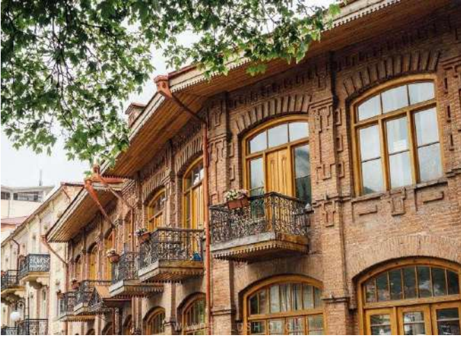
Eski Şehir, Şeki