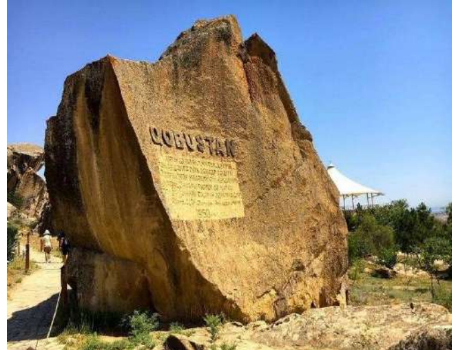
Gobustan Rock Art Cultural Landscape